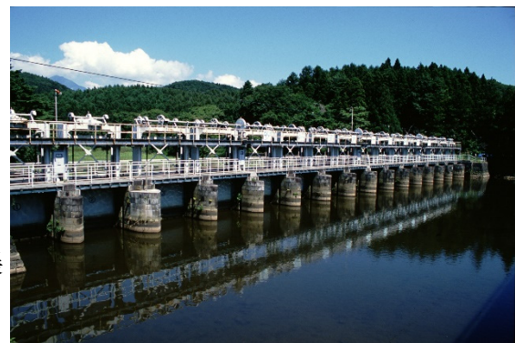
写真－1 安積疏水十六橋水門 Jyurokkyo Water Gate for the Asaka Irrigation